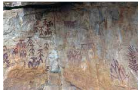
Pinturas rupestres de Peña Escrita

Dejando el coche en el aparcamiento de las pinturas rupestres de Peña Escrita se toma el camino de Peña Escrita y Navamanzano y dejando a nuestra izquierda la señalización del Barranco de Peña Escrita y cruzando el arroyo de Peña Escrita subiremos hasta el collado del Escorialejo donde encontramos la señalización de la senda hacia la izquierda.