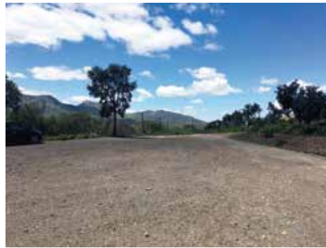
Aparcamiento Peña Escrita

Continúe recto hasta llegar al merendero junto al campo de fútbol. Ahí encontrará un cruce. Debe girar a la derecha y seguir las indicaciones hasta Peña Escrita.