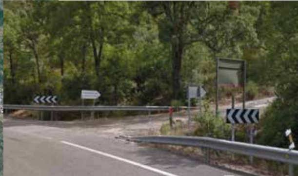
Entrada a pinturas rupestres

Salga de Azuel, y tome dirección Fuencaliente. Continúe por la N-420 durante 13,8 Km. Hasta llegar al desvío para las pinturas rupestres.