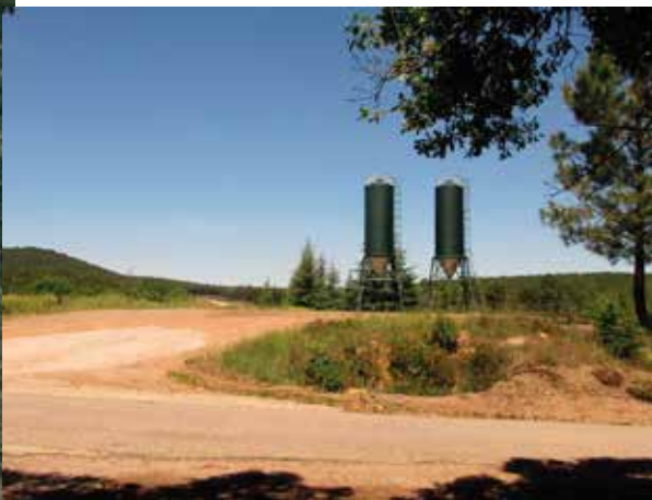
Entrada camino de Ventillas

Salga de Azuel, y tome dirección Fuencaliente. Continúe por la N-420 durante 19,3 Km. Hasta llegar al camino de Ventillas. Lo localizará a la izquierda por unos silos de gran altura.