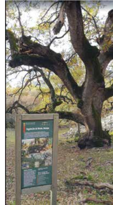
Roble El Abuelo

Este recorrido atraviesa por el pinar más antiguo de los montes de Fuencaliente con una edad de casi 70 años pudiéndose observar buitres negros, Águilas imperiales, ciervos, cabras montesas y corzos llegando a uno de los robledos más extensos y de mejor calidad de roble melojo del sur peninsular, para llegar al roble centenario conocido como “EL ABUELO” y todo ello disfrutando de magníficas vistas.