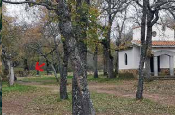
Puente de acceso a ruta. Al lado de la Ermita de San Isidro

Salga de Azuel, y tome dirección Fuencaliente. Continúe por la N-420 durante 15,9 Km. Hasta llegar al área recreativa de San Isidro.